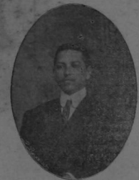
General Benjamin Zeledón

muerto en su retirada de Masaya, después de una derrota